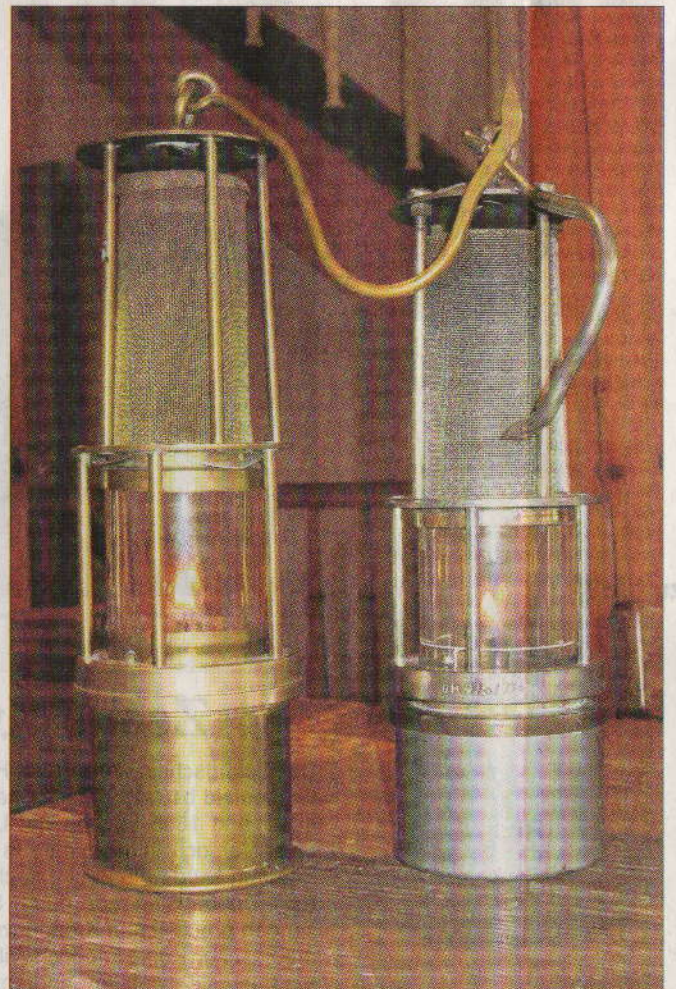
Die Grubenlampen sind so etwas wie das Symbol des Bergmanns geworden. Über dem Schacht 2 der ehemaligen Zeche Christian Levin wird der Bürger- und Verkehrsverein Dellwig/Gerschede ein solches Zeugnis in stark vergrößertem Maßstab aufstellen.

macht: eine Vielzahl von heterogenen und doch vernetzten Orten und Menschen, vereint durch die Vergangenheit ebenso wie durch eine gemeinsame Zukunft“, flechtet das Jahresprogrammheft der Kulturhauptstadt seine Absichten mit Pathos zu einem Gedenkkranz im „Programmfeld ‚Mythos Ruhr be-greifen‘“. Vier Kriterien enthielt der offizielle Bewerberkatalog für die Teilnahme an der „SchachtZeichen“-Veranstaltung: Im gesetzten Stichjahr 1919 musste die jeweilige Zeche in Betrieb sein oder danach in Betrieb genommen werden. Mit Ausnahme der Ruhrtalzechen wurden nur ehemalige Tiefschächte (im Gegensatz zu Stollenzechen oder Schrägschächten) zugelassen. Ebenso wurden Kleinzechen ausgeschlossen. Nicht bewerben durften sich solitären Wetterschächte ohne Förderung. Für Essen wird von 70 potentiellen „Schachtzeichen“ ausgegan-