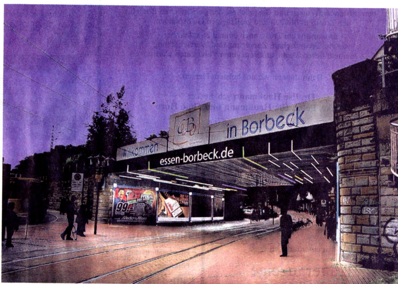
Viele kleine Einzelspenden aus dem Stadtteil halfen mit, den Tunnel zum neuen Markt zu beleuchten und zu säubern. Da die Vermieter der Werbetafeln für den Strom aufkommen, können die Lampen auch am Tag brennen.