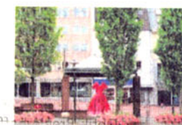
So könnte der alte Markt gestaltet werden.

Im Juni sind die Anträge ans Land gegangen. Passiert nichts Unvorhergesehenes, könnte 2012 gekneippt werden. Es braucht halt alles seine Zeit.